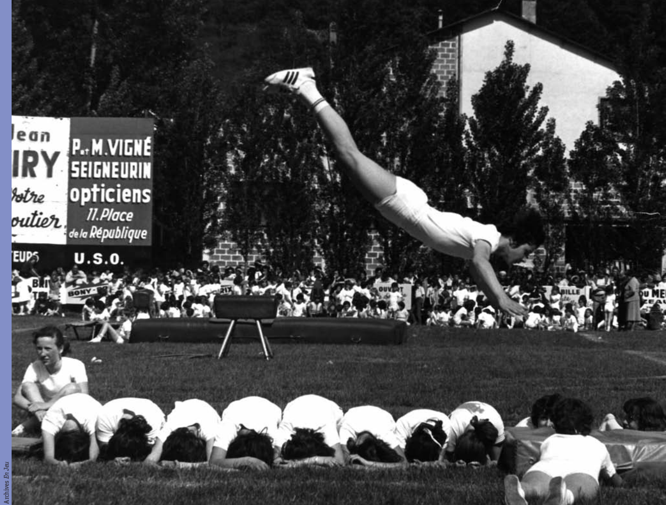
Archives En Jeu